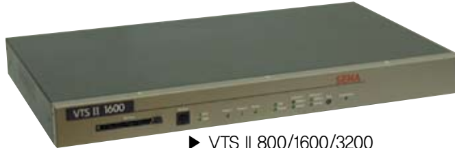
▶ VTS II 800/1600/3200 8/16/32-포트 지능형 콘솔 서버